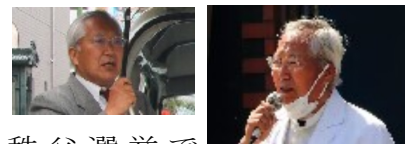
秩父選挙で 水道料金値上げ問題演説

昭和34年12月28日 倉尾小・中・学校・小鹿野高校卒・上智大学イスパニアセンター・慶応大学中退・労働金庫・上場建設会社・証券会社・不動産会社 家族：男（同居）女（財務省） 住所：秩父郡小鹿野町藤倉2090 携帯：090-1855-1408 tel/fax:0494-78-0725 編集/発行新井富士男後援会